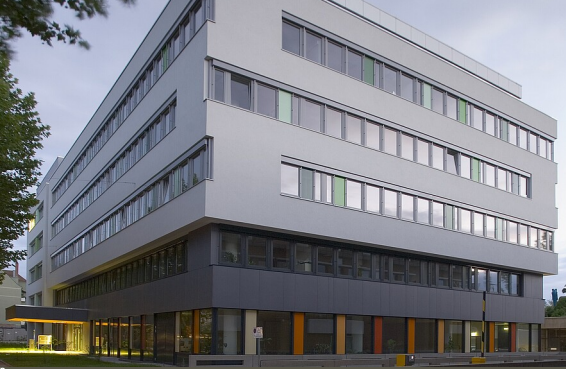
Albrecht Imanuel Schnabel